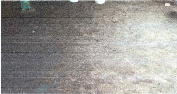
Foto 5: Mejoramiento losa de patio (torta de concreto): Se mejorará la torta de concreto con nuevo material.