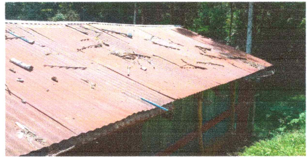
Foto 6: Canales y bajada de agua pluvial: Se sustituirán los canales de metal por canales cuadrados de metal.

Observación: Si es necesario se pueden agregar hojas adicionales y actualizar el número de hojas.