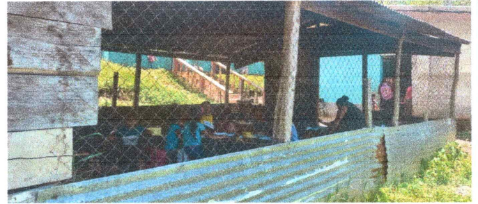
Foto 8: Mejoramiento pared de lámina y malla por Block (aula): Se sustituirán las paredes de malla y lámina por block.