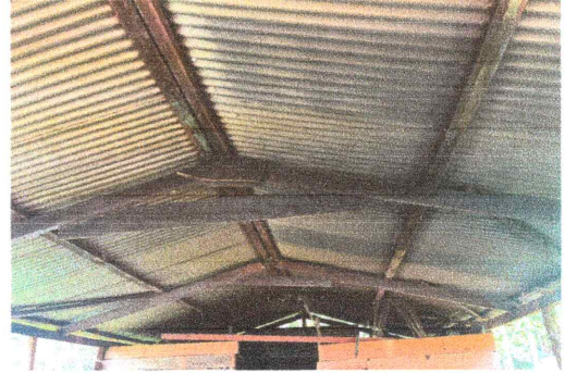
Foto 2: Estructura de techo (Sustitución de soporte de madera por metal): Se cambiarán las Vigas y costaneras de madera por metal.