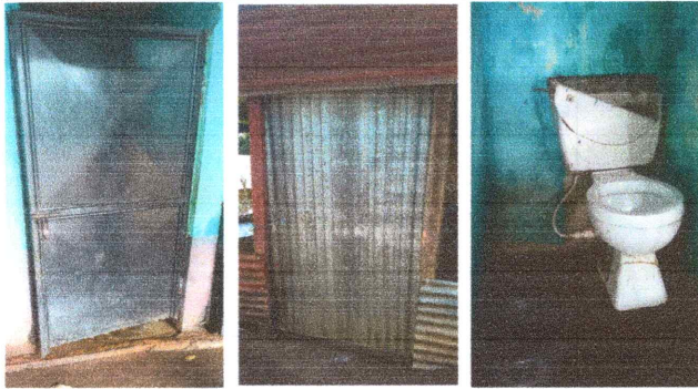
Foto 3: Puertas de metal (aulas y sanitarios): Se cambiará la puerta de lamina por puerta de metal para aulas, y se sustituirá la puerta de metal para baños, así como la sustitución de sanitarios blancos pequeños.