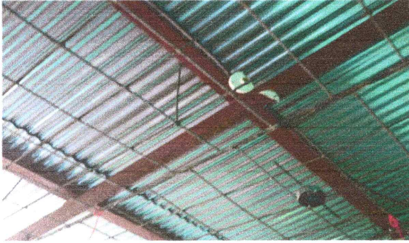
Foto7: Mejoramiento sistema eléctrico: Se sustituirán los cables inservibles y demas suministros electriccos por nueva instalación.