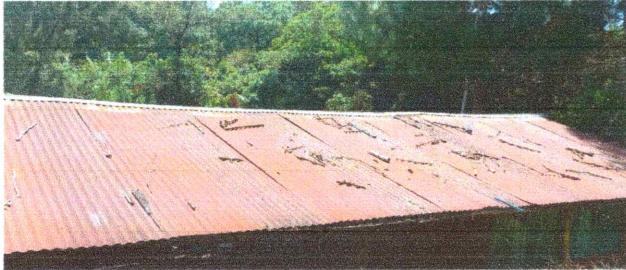
Foto 1: Cubierta de Láminas: Se sustituirán las láminas acanaladas por láminas troqueladas.